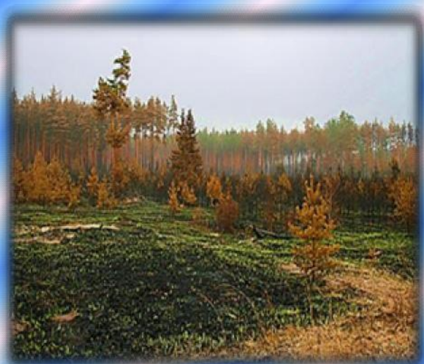
Молодой лес, погибший от пала сухой травы