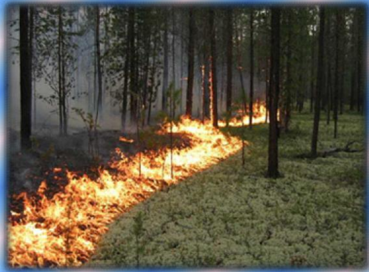
Низовой беглый лесной пожар