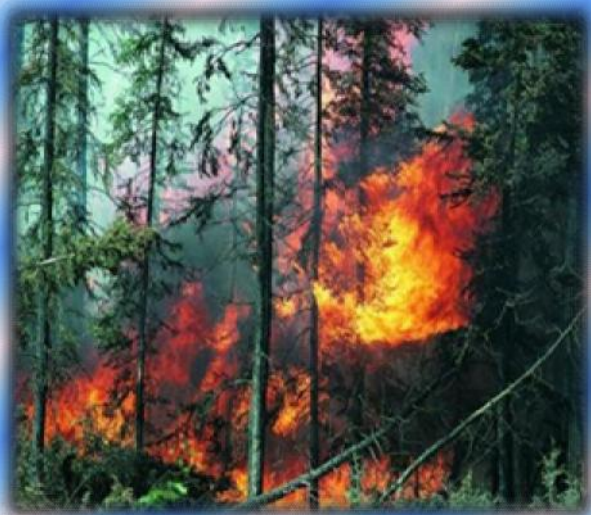
Переход лесного пожара с нижнего в верхний