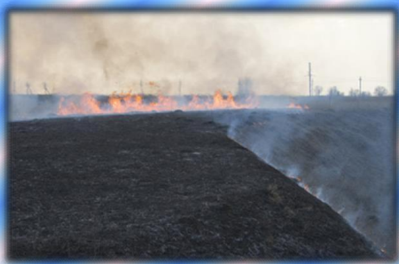
Весенний пал сухой травы.