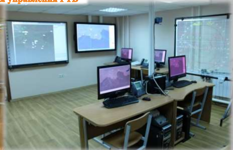
Командный пункт радиотехнических бригад