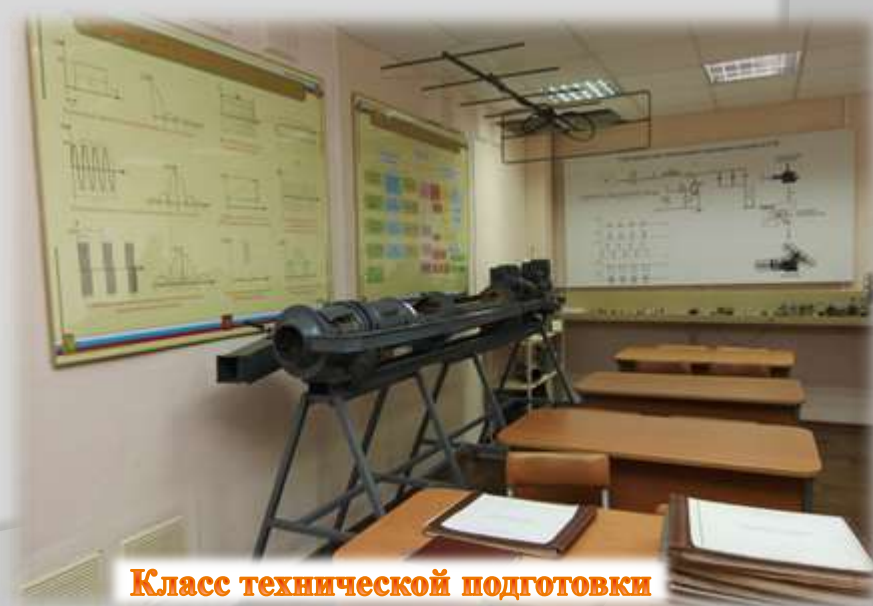
Класс технической подготовки