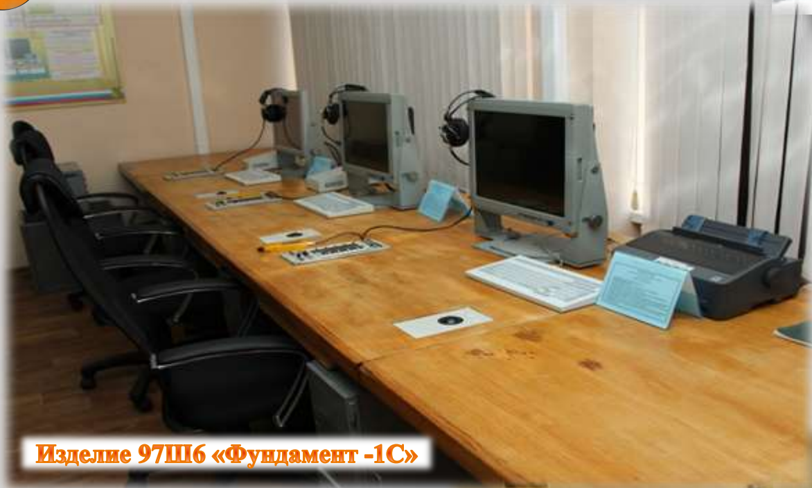
Изделие 97Ш6 «Фундамент -1С»