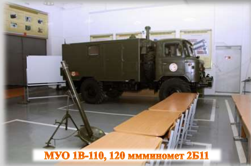
МУО 1В-110, 120 мм миномет 2Б11