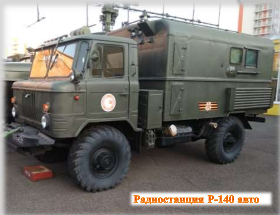
Радиостанция Р-140 авто