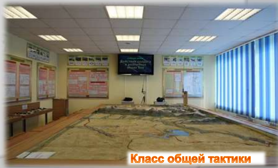
Класс общей тактики