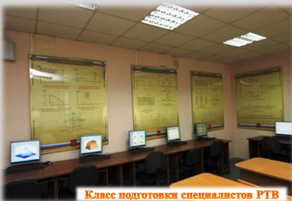
Класс подготовки специалистов РТВ