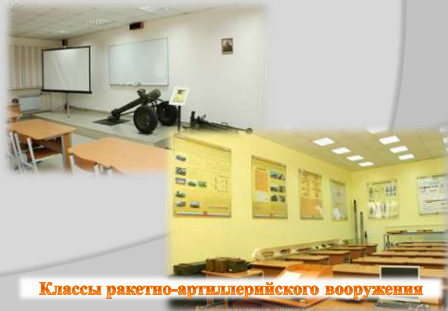
Классы ракетно-артиллерийского вооружения