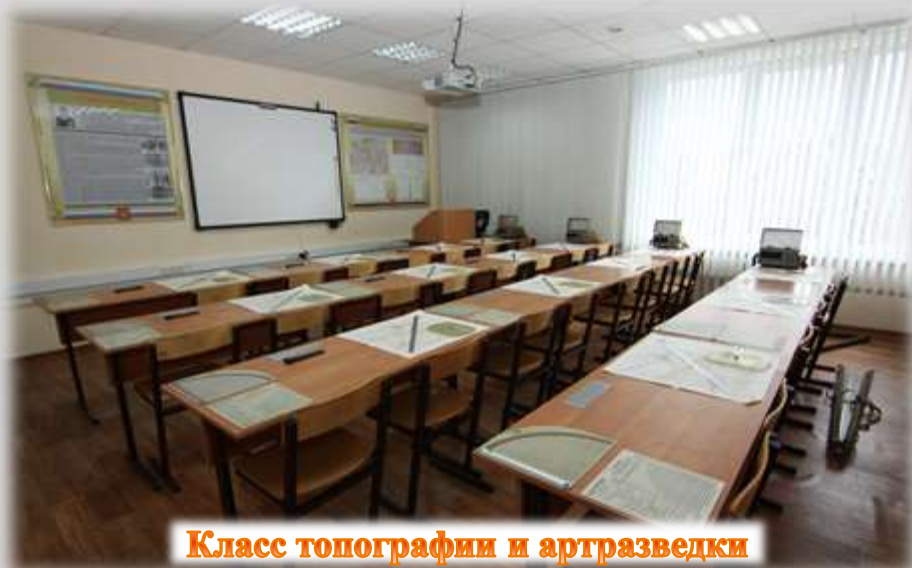
Класс топографии и артразведки