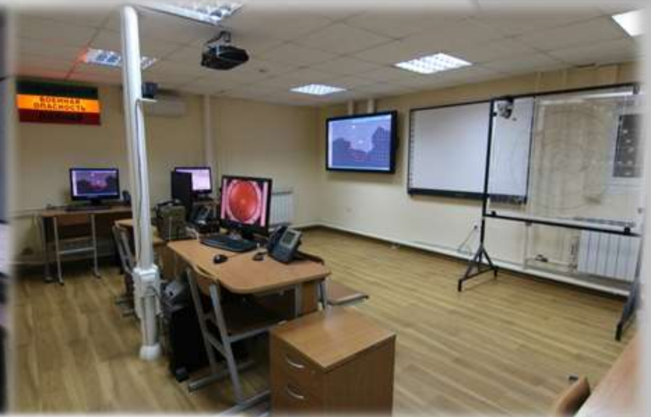
Учебные пункты управления РТВ