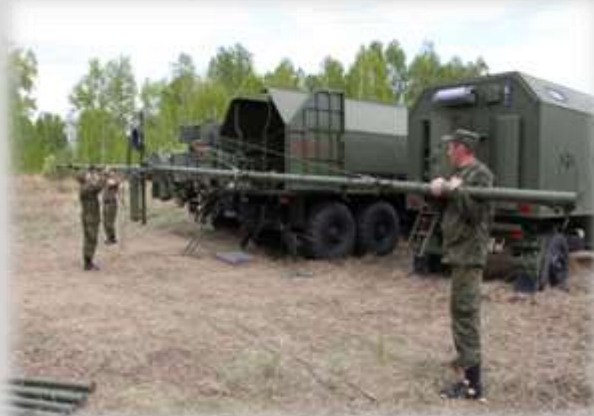
Преодоление зараженного участка