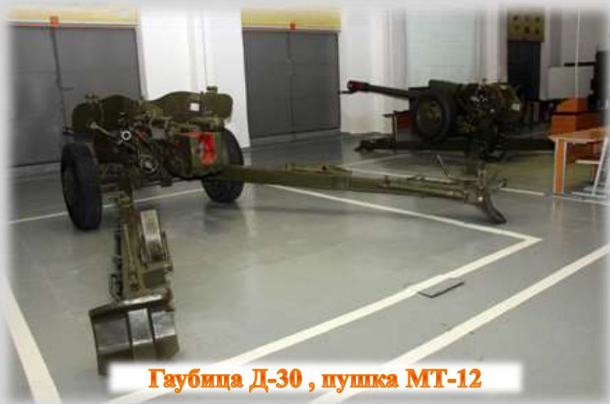
Гаубица Д-30 , пушка МТ-12