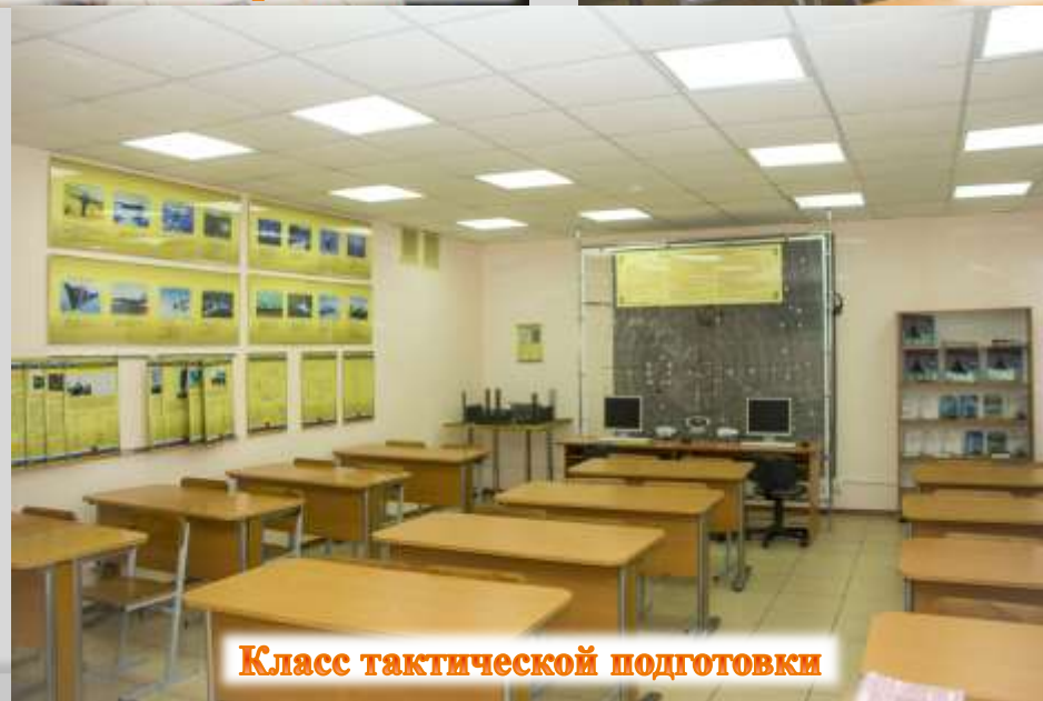
Класс тактической подготовки