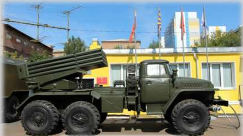
БМ-21 РСЗО «Град»