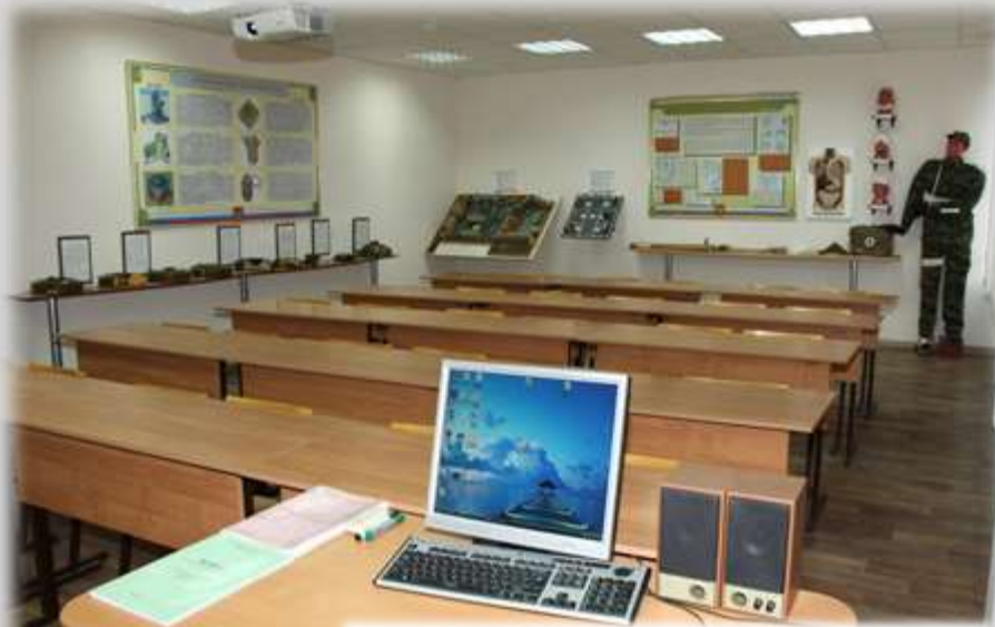
Класс общевойсковой подготовки