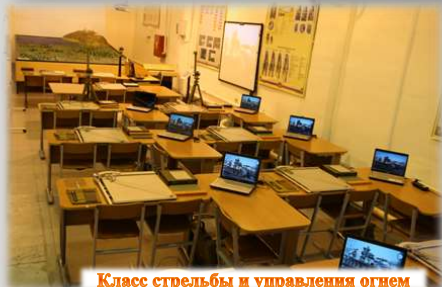
Класс стрельбы и управления огнем