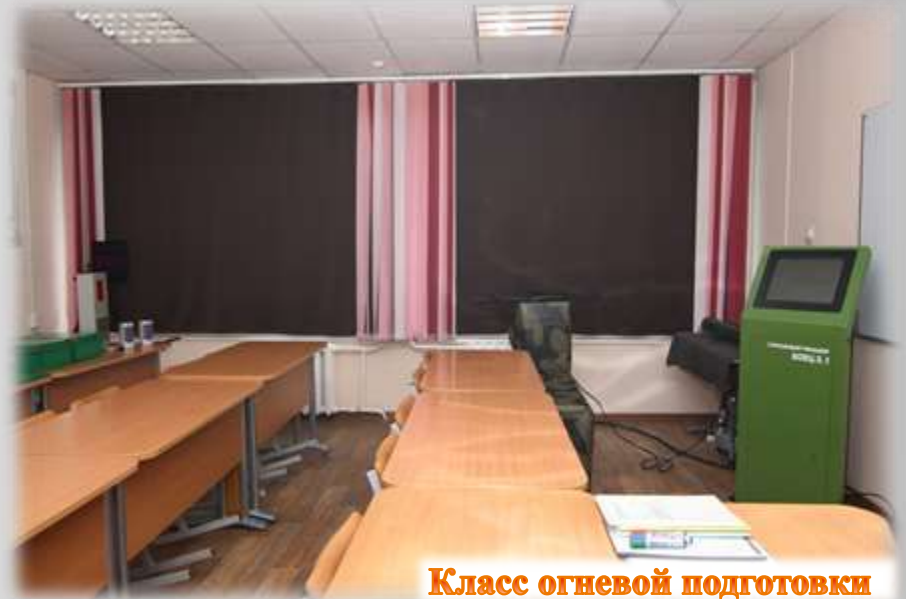
Класс огневой подготовки