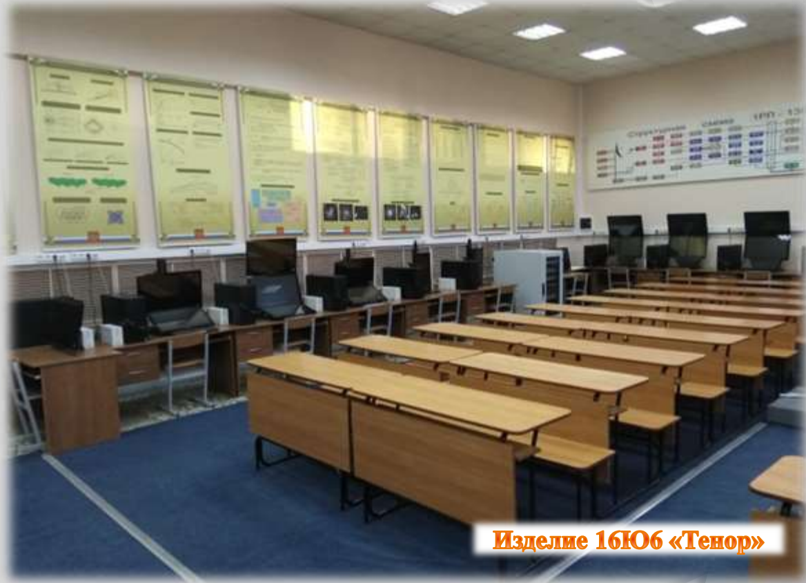
Изделие 16Ю6 «Тенор»