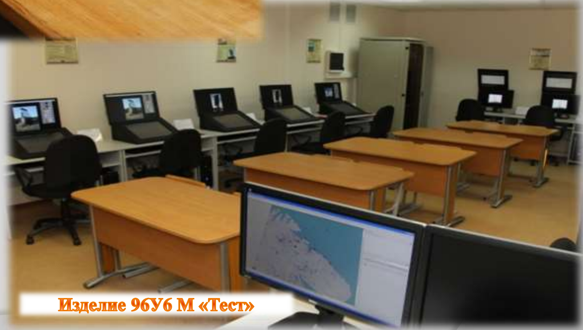
Изделие 96У6 М «Тест»