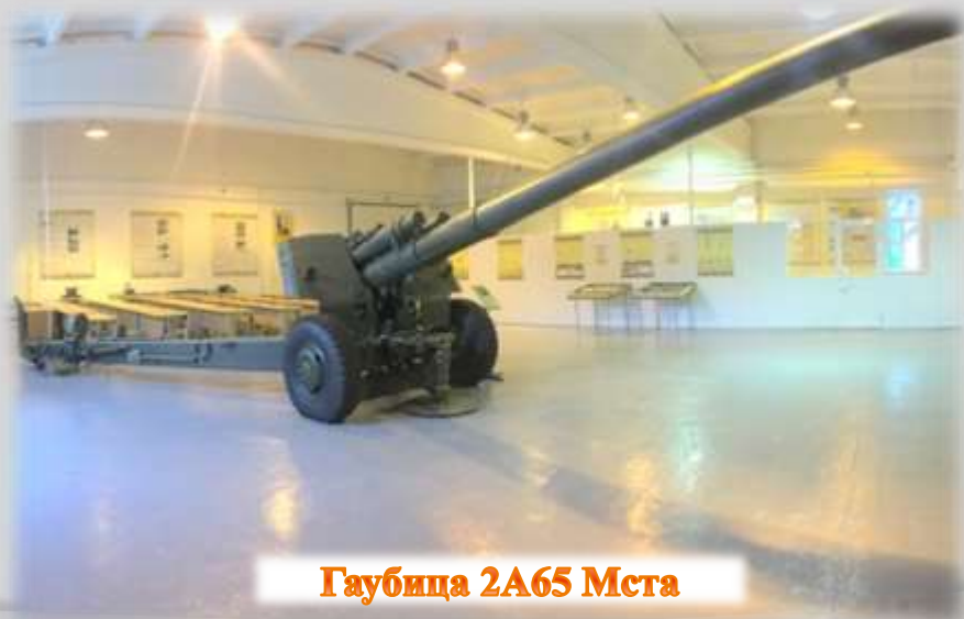
Гаубица 2А65 Мста