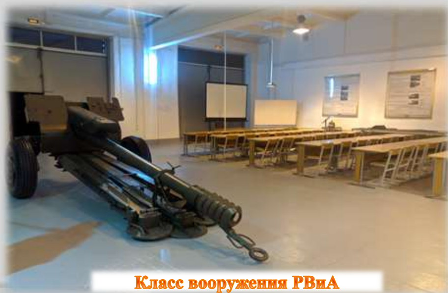
Класс вооружения РВИА