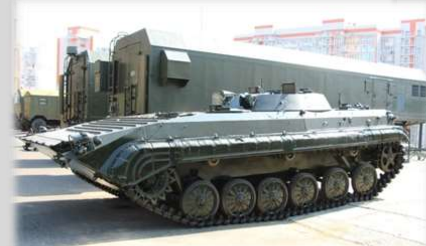
Подвижный разведпост ПРП-3