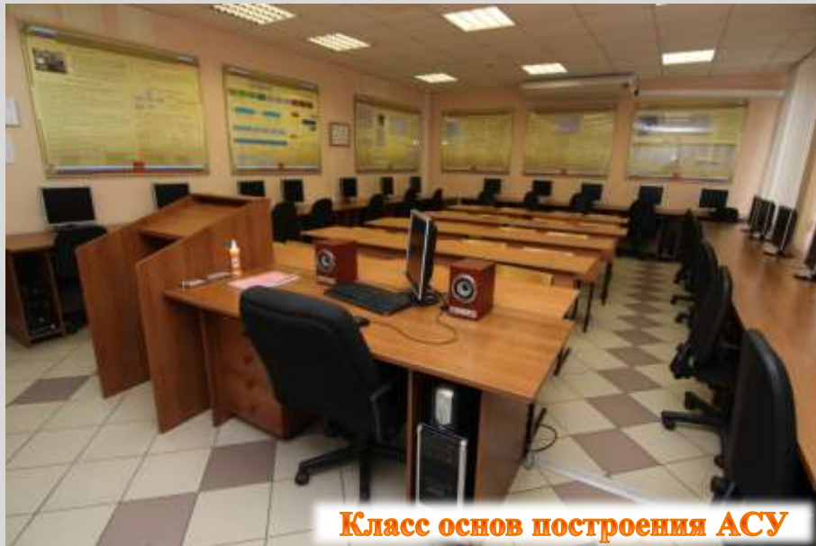
Класс основ построения АСУ