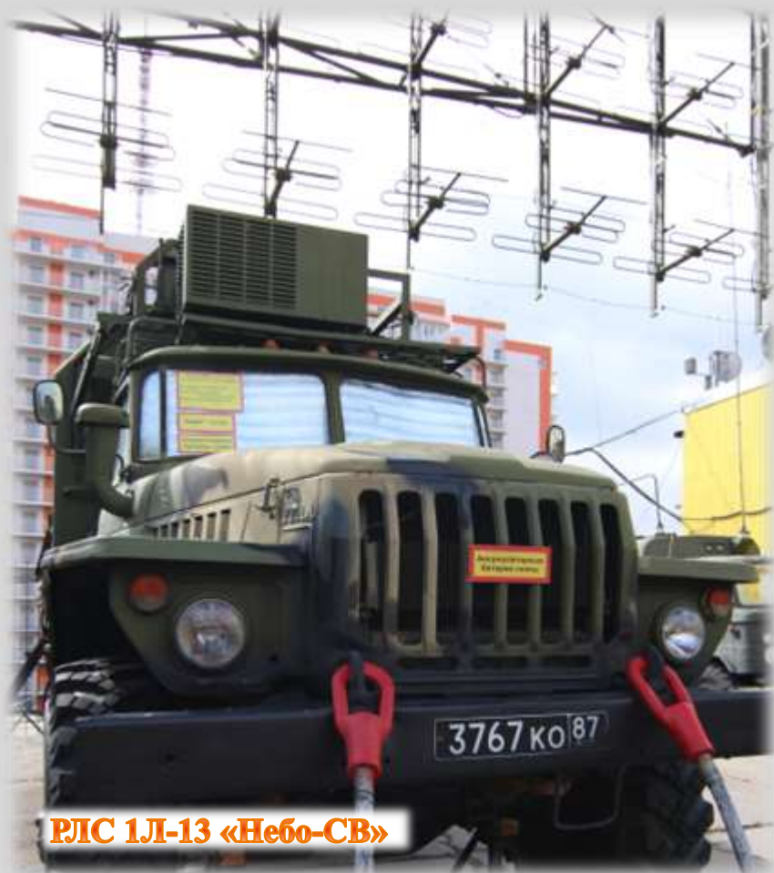
РЛС 1Л-13 «Небо-СВ»