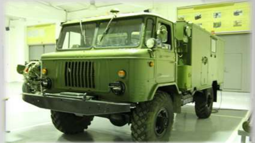
Машина управления огнем МУО 1В110