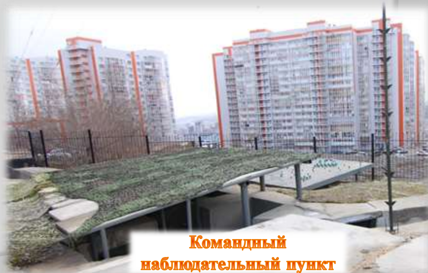
Командный наблюдательный пункт