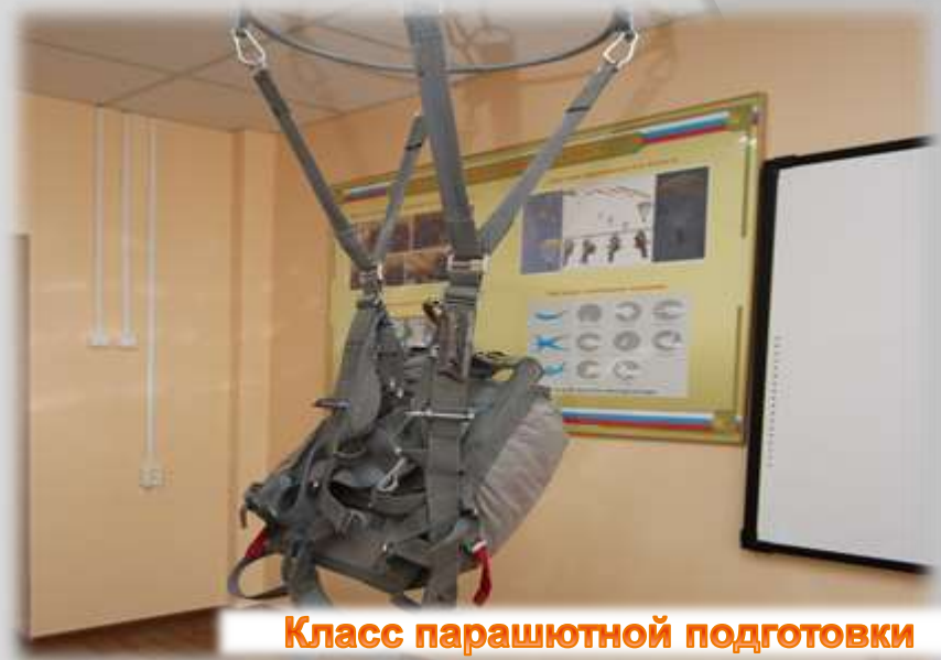
Класс парашютной подготовки