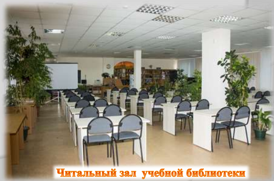
Читальный зал учебной библиотеки