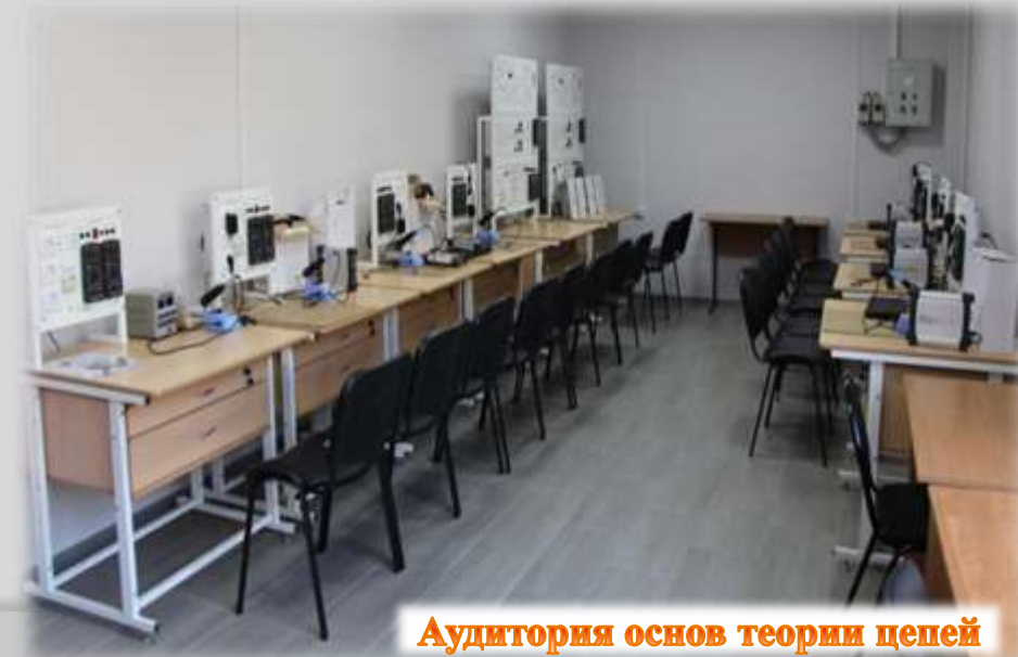
Аудитория основ теории цепей