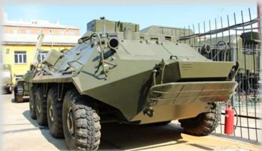
Машина управления огнем МУО 1В18