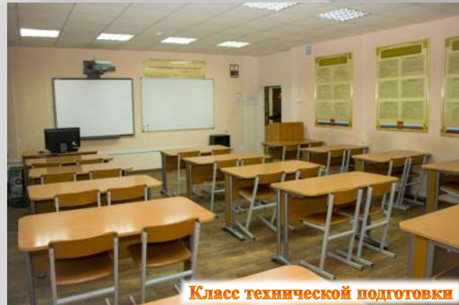
Класс технической подготовки